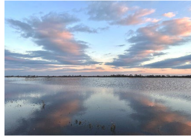
Februar: E. Solte