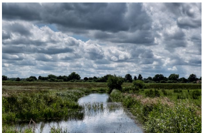
September: R. Kretschmann