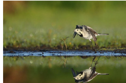
Oktober: O. Klann