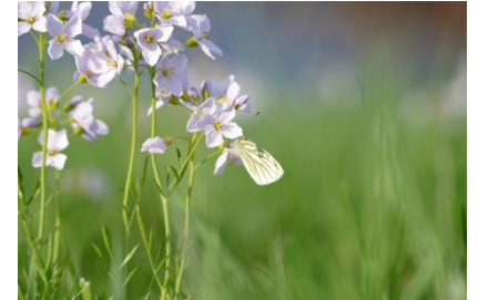
April: E. Solte