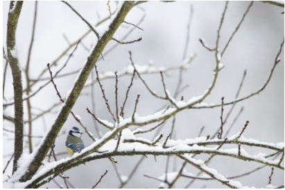
Januar: T. Gottschalch