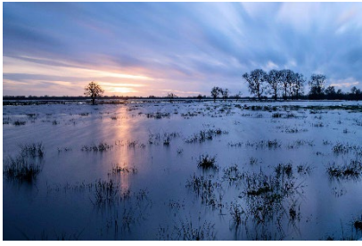
Titelbild: R. Deseniß