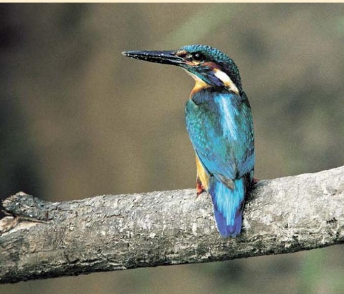
Eisvogel – geschützt nach EG-Vogelschutzrichtlinie

Mit seinem tropisch-bunten, blau und rot schillernden Gefieder gehört der Eisvogel zu den farbenprächtigsten heimischen Vögeln. Tatsächlich leben seine zahlreichen Verwandten überwiegend in den tropischen Regionen unserer Erde. Bisweilen sieht man den „Fliegenden Edelstein“, wie der Eisvogel im Volksmund auch genannt wird, in schnellem Flug mit einem lauten Pfiff einen Fluss entlang flitzen. An natürlichen Flüssen fühlt sich der Eisvogel besonders wohl. Hier findet er alles, was er zum Leben braucht. Dazu gehören vor allem viele kleine Fische, von denen er sich hauptsächlich ernährt. Manchmal sieht man den Eisvogel ganz ruhig auf dem Ast eines niedrigen