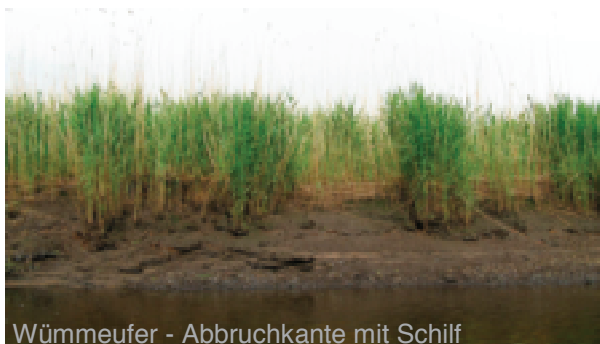
Wümmeufer - Abbruchkante mit Schilf

Bei zahlreichen Veranstaltungen im diesjährigen Programm ( blaue Schrift ) sind die Auswirkungen des Weserausbaus und die Zukunft der Wümmelandschaft Thema. Machen Sie sich kundig, engagieren Sie sich für den Erhalt unserer heimatischen Flusslandschaft – ein Schutzgebiet von europäischem Rang (NATURA 2000).